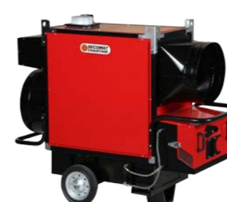
Réservoir intégré Tank kit