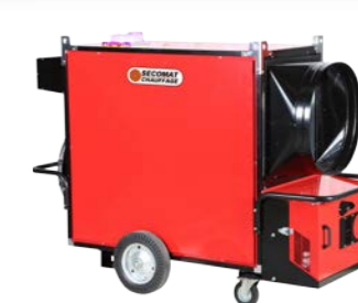
Kit roues avant pivotantes Swivelling front wheels kit