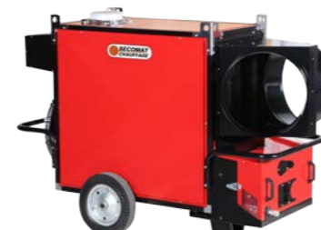
Adaptateur 2 sorties Two ways adapter