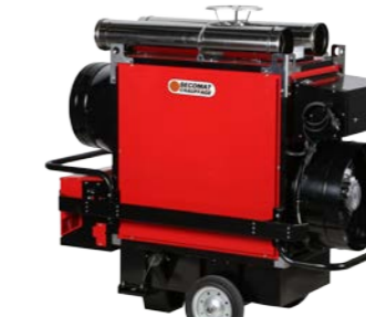
Adaptateur de reprise d'air et kit transport cheminée Air inlet adapter and chimney shelter kit