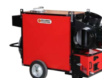
Adaptateur 4 sorties Four ways adapter