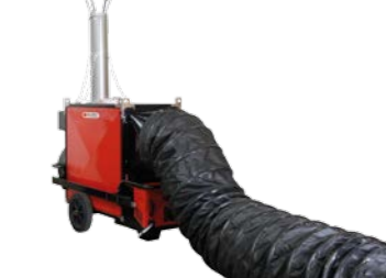
Gaines de soufflage ou de reprise d'air Air outlet or inlet ducts