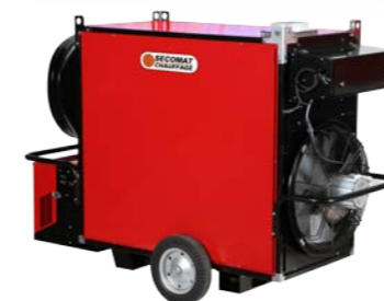
Ventilateur hélicoïde Axial fan