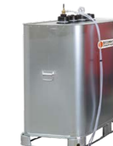
Cuve fuel double paroi mobile avec crépine 2 x 4 M Mobile double wall oil tank with dual oil 2 x 4 M