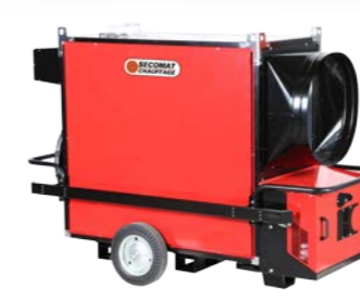
Kit protections + kit fourches Side bumpers + lifting kit